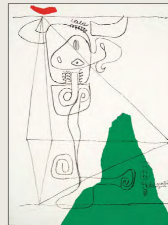
Taureau I, 1964, Lito 72 x 54 cm