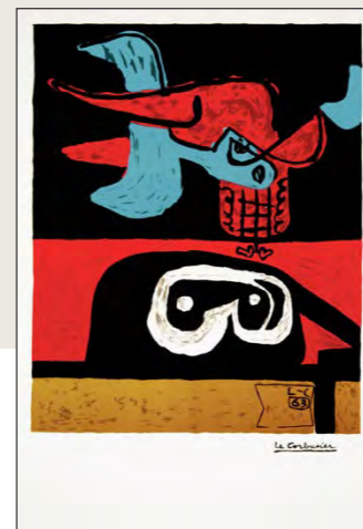
Autrement que sur terre, 1963, Lito 72,2 x 50 cm