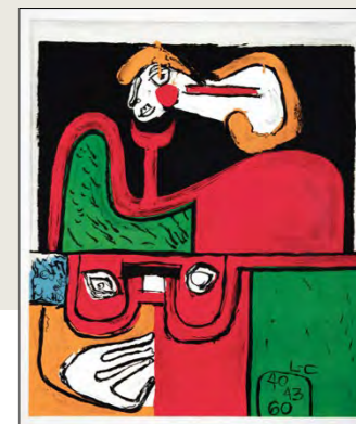
Portrait, 1960, Lito 76 x 64 cm