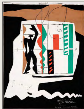
Modulor, 1952, Lito 73,4 x 54,2 cm